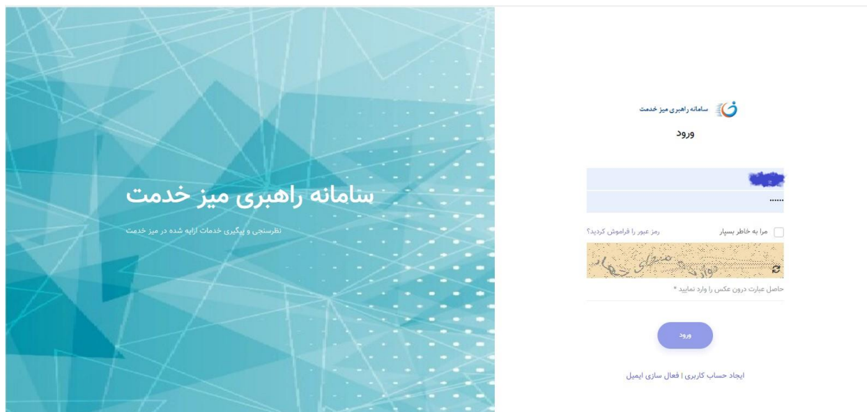
تصویر صفحه ورود

نام کاربری و رمز عبوری که توسط ستاد برای شما تعریف شده است وارد کنید کد امنیتی محاسبه کنید و دکمه ورود بزنید